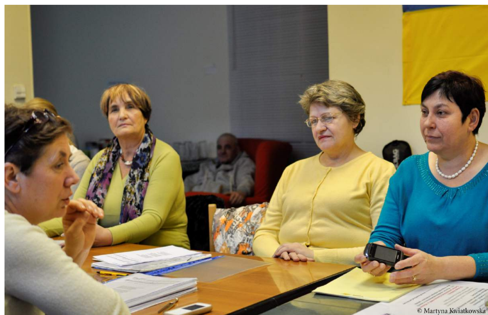
PRÓBA ZESPOŁU KLUBU UKRAIŃSKICH KOBIEC „KALYNA”

Przykładem samodzielnych działań klubowiczek jest zespół Klubu Ukraińskich Kobiet „Kalyna”, który utworzyły kobiety migrantki. Zespół „Kalyna” jest żeńskim zespołem wokalnym; założony w czerwcu 2014 roku. Uczestniczkami zespołu są kobiety migrantki z Ukrainy, mieszkające i pracujące w Warszawie. Zespół „Kalyna” występował w ramach obchodów Dnia Niepodległości Ukrainy 2014, na festiwalu Krakowskie Reminiscencje Teatralne 2014, Wielokulturowym Street-Party w Warszawie 2014 oraz w ramach Dnia Ukrainy 2015 w Orońsku.