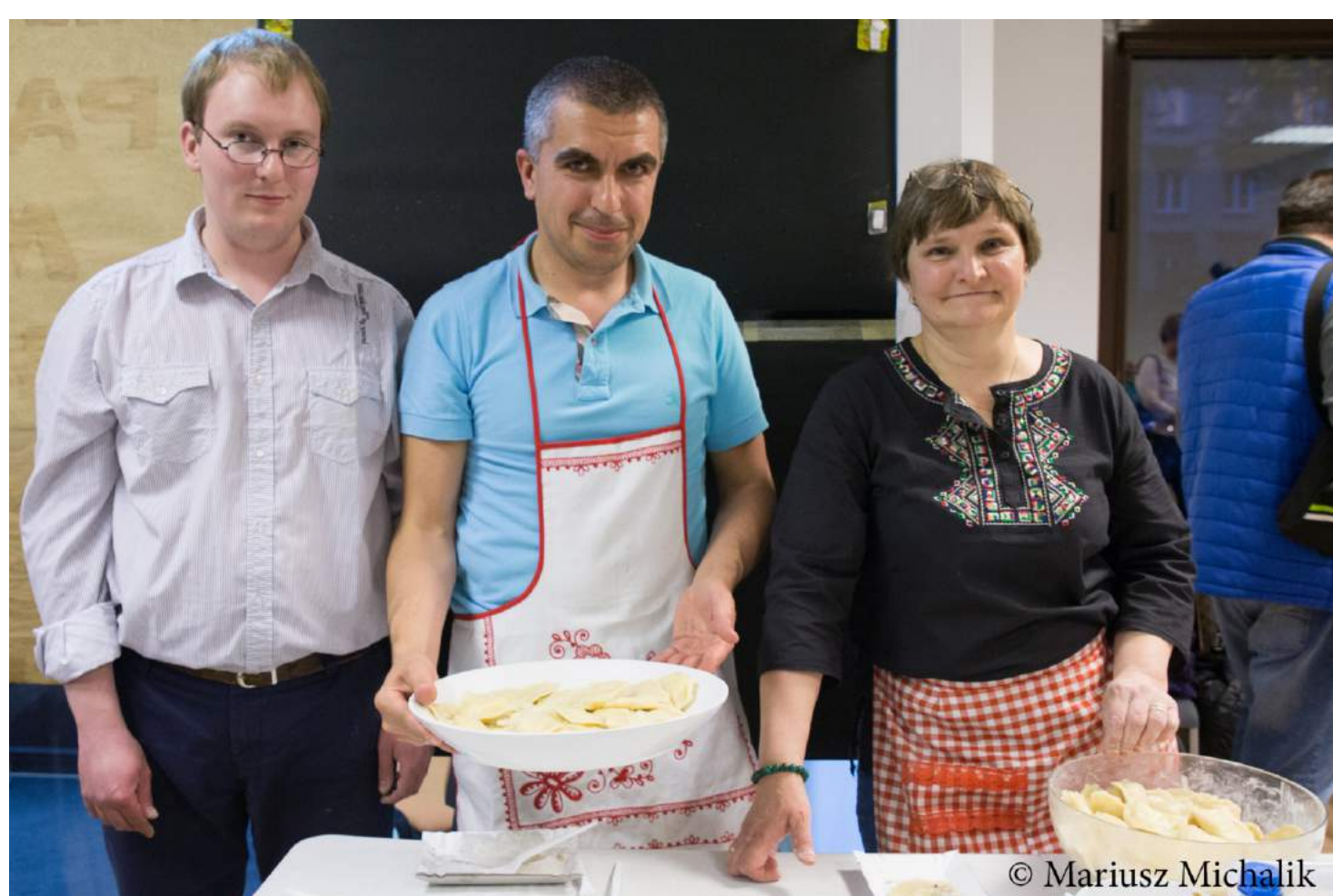
WARSZTATY ROBIENIA PIEROGÓW