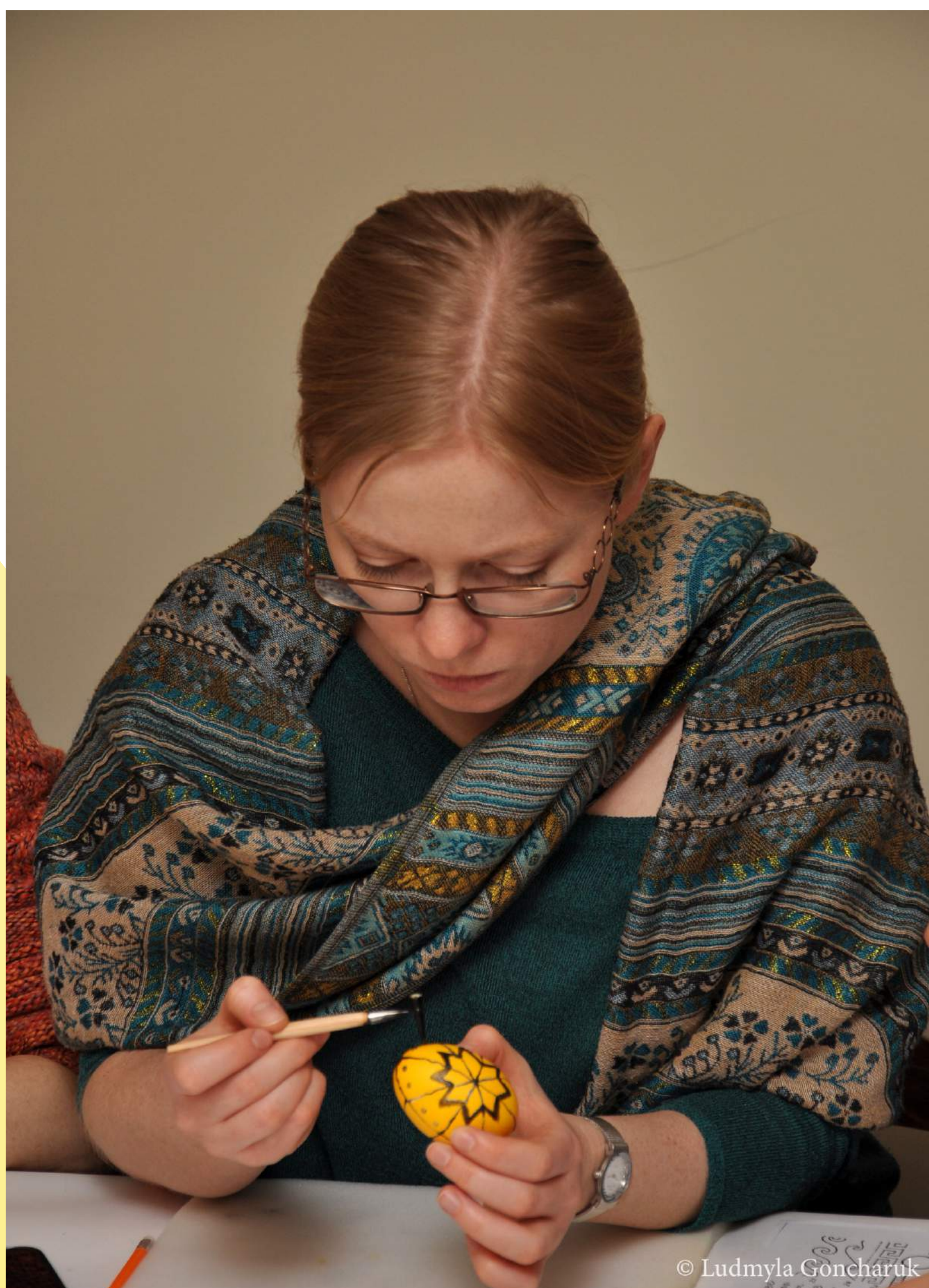
WARSZTATY ROBIENIA TRADYCYJNYCH UKRAIŃSKICH PISANEK