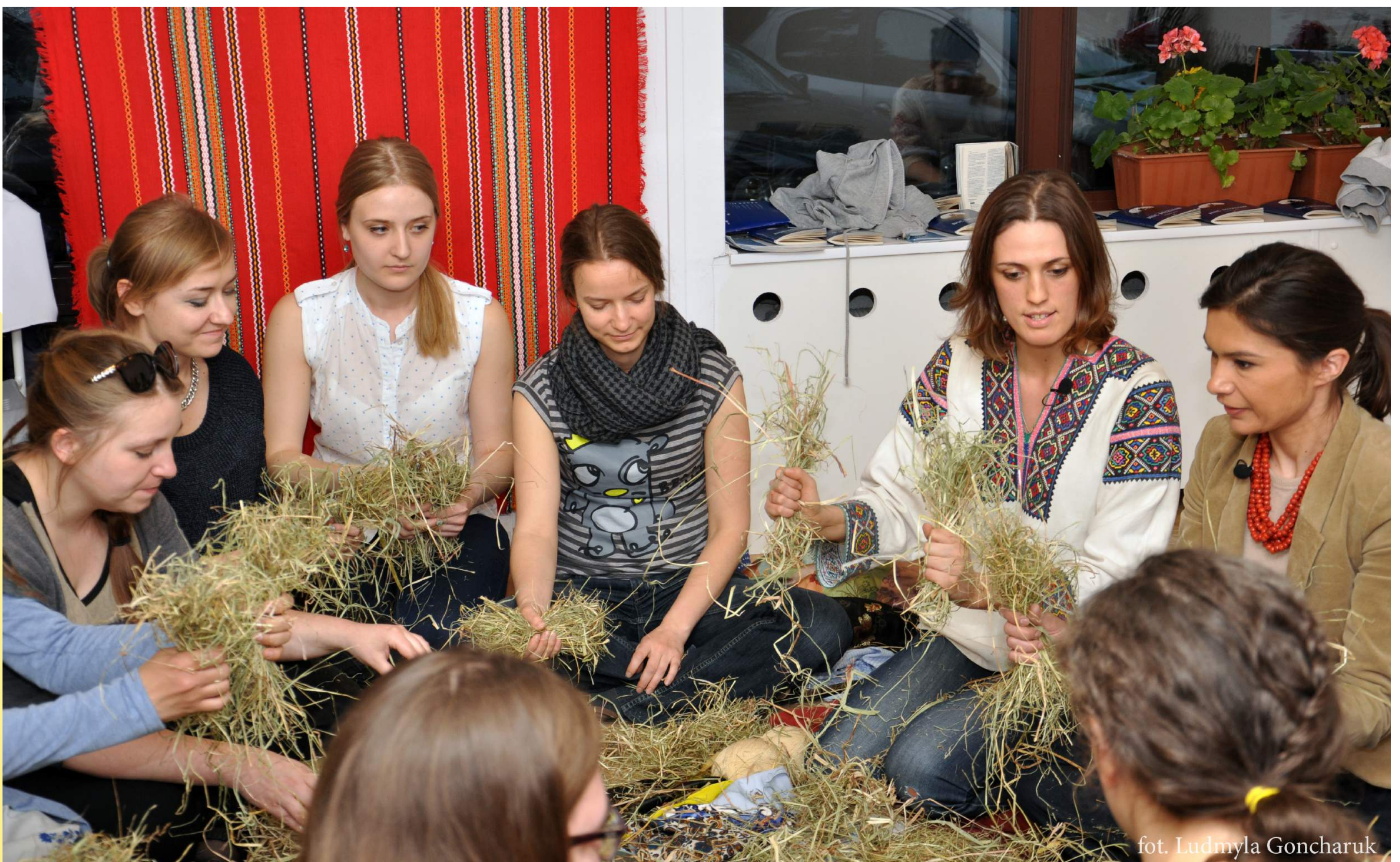
NOC MUZEÓW W UKRAIŃSKIM DOMU W WARSZAWIE