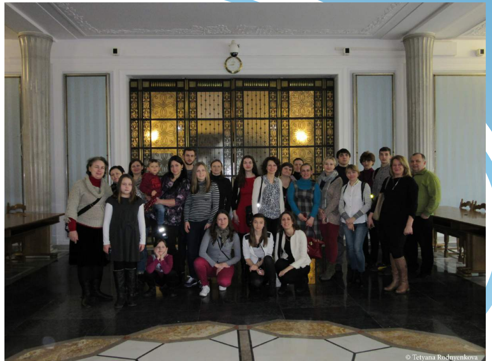
WIZYTA W SEJMIE I SENACIE RP