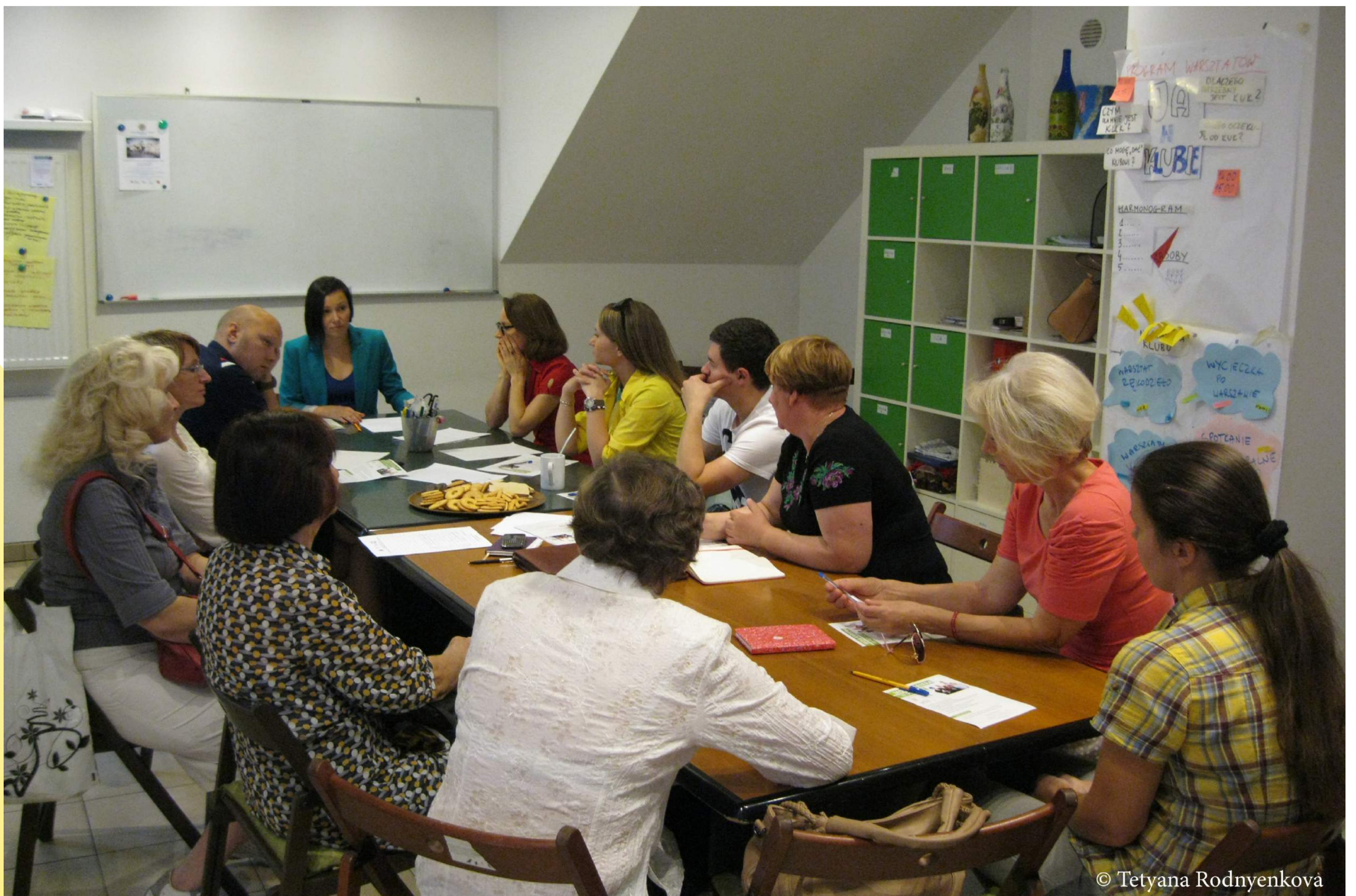
SPOTKANIE PT. "MOJA KARIERA W POLSCE" Z EKSPERTKĄ POLSKIEGO FORUM MIGRACYJNEGO