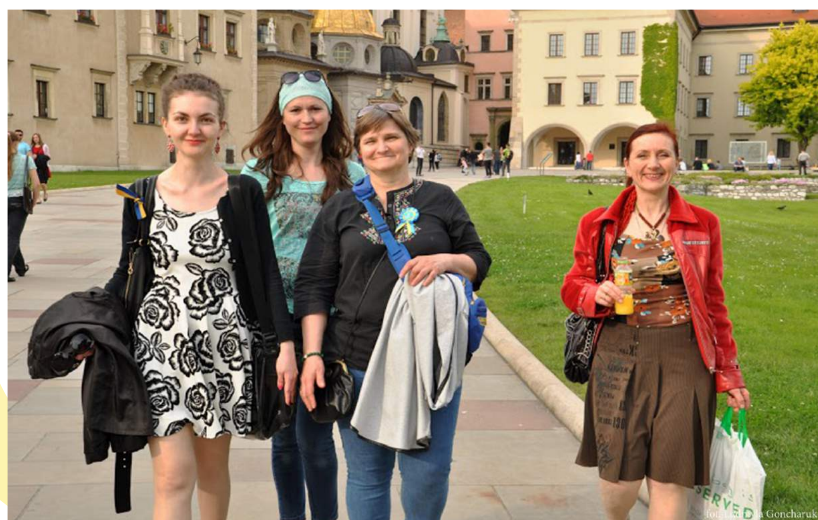
WIZYTA STUDYJNA W KRAKOWIE