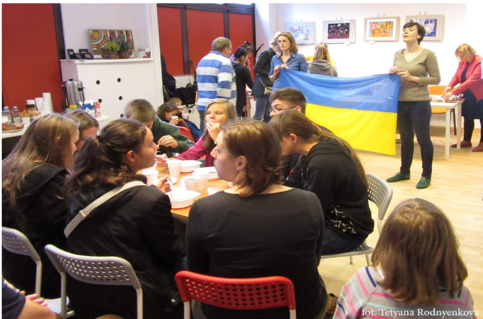
MIEJSKA AKCJA WOLONTARIACKA „OCHOTNICZY WARSZAWY”