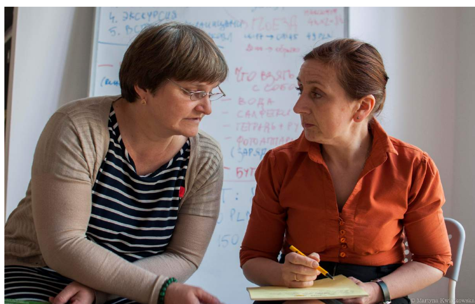
PRZYGOTOWANIE DO WIZYTY STUDYJNEJ W KRAKOWIE

Klub Ukraińskich Kobiet został założony Fundacją „Nasz Wybór” w ramach programu “Obywatele dla Demokracji”, finansowanego z Funduszy EOG.